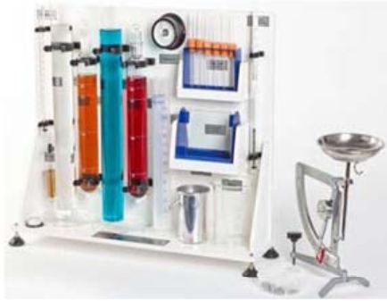
جهاز قياس خصائص المائع Fluid Properties Apparatus يستخدم لقياس خصائص السوائل كالكتافة واللزوجة وسرعة سقوط الاجسام الصلبة في السوائل