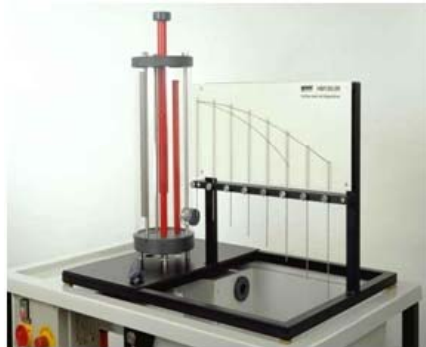
الجريان الافقي من خزان Horizontal Flow From A Tank يستخدم لتمثيل الجريان من فتحة جانبية