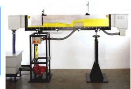
قناة مختبرية 300 مم x 86 مم Experimental Flume 86x300mm يستخدم في دراسة تاثير المنشآت الهيدروليكية على طبيعة الجريان